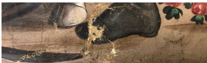
Schäden am Fahnenbild: Risse und Farbabplatzungen

Diese Analyse wird durch die rückseitige Aufschrift am Seidendamast-Stück bestätigt: „Sante Joannes ora pro nobis 1858“. Und dieser Befund stimmt auch mit dem gemalten Bildteil überein, denn nach