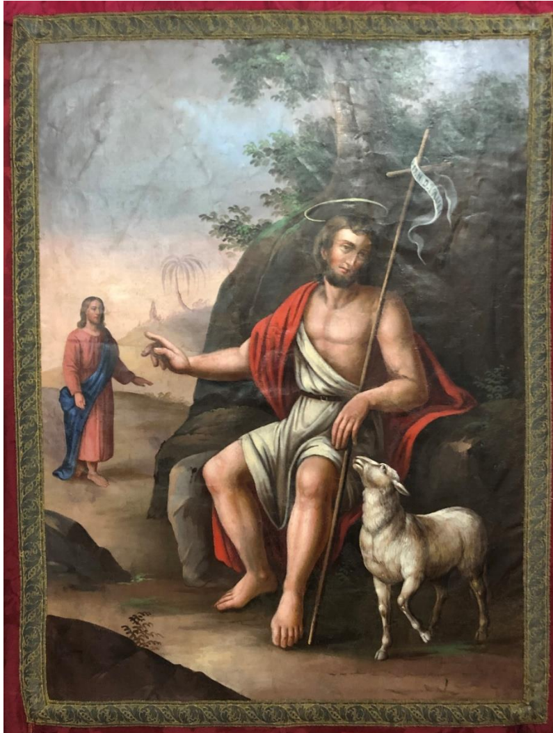
Die restaurierte Fahnenrückseite: Johannes der Täufer

Die Bildleinwand selbst, eine einfache doppelseitig bemalte und durch Wind und Wetter verbeulte und verzogene Leinwand, wies Löcher und Risse sowie zahlreiche Farbabplatzungen auf. Nach der Fadenzusammenführung, Glättung und Konsolidierung der Malschicht erfolgten die Abnahme der alten Übermalungen und Verkittungen, Neuverkittung, Retusche und Aufbringung einer