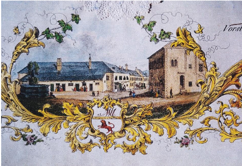
Illustration der Mödlinger Fleischbänke auf einem Meisterbrief um 1820. Im Wappen findet sich der Mödlinger Panther und darüber das Kürzel MM für Markt Mödling.

war ja bereits zollrechtliches Ausland, mit Auswirkungen auf den Viehhandel für unsere Region und mit der genauen Beobachtung und Kontrolle hinsichtlich des Einschleppens von Krankheiten für Mensch