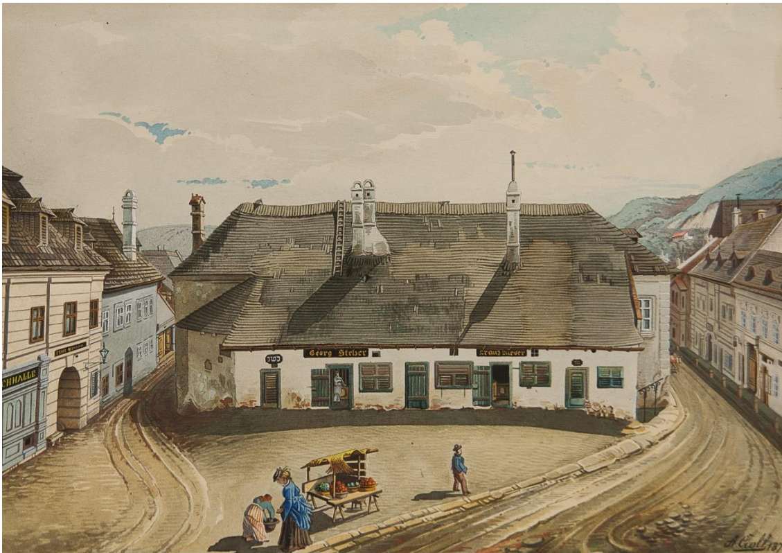
Die 4 Mödlinger Fleischbänke, gemalt 1874 von Andreas Groll im Auftrag von Joseph Schöffel, um die Zustände und folgenden notwendigen baulichen Veränderungen Mödlings zu dokumentieren. Die Türe ganz links ist als Verkaufsstelle von koscherem Fleisch gekennzeichnet.

Jedenfalls versuchen die örtlichen Mödlinger Fleischhauer im Rahmen der Zunft ihre Marktstellung immer wieder zu behaupten: so verkaufen sie um 1700 das Pfund Fleisch um 5 – dem Wiener Preis - statt um die vom Mödlinger Rat festgelegten 4 ½ Kreuzer. Nach Einschreiten des Rates und nach Beratung mit dem Wahlkommissar wird von den Fleischhuern eine Regierungsbewilligung für den Verkauf zu diesem Wiener Preis verlangt, der nicht vorgelegt werden kann. Ein folgender Streik der