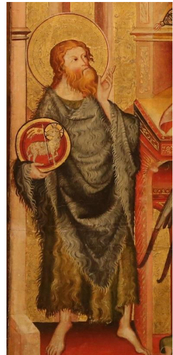
Darstellung Johannes des Täufers – Rückseite des Verduner Altars in Klosterneuburg, 1330. Motiv für das Siegel der Mödlinger Fleischhauer.

Im 1. Türkensturm 1529 wurde Mödling fast gänzlich zerstört, Zuzügler mussten her, die den Herrschaften Rechte abrangen, die religiöse Abwendung der Mödlinger zu Martin Luther kam hinzu, der Wiederaufbau der Othmarkirche als katholische Kirche war der Bevölkerung kein Anliegen, es waren schwierige Zeiten, die uns keine Dokumente hinterlassen haben. Wir wissen nichts Näheres über die Lebensumstände, nur dass es 2 Fleischbeschauer als Kontrolloren über die Arbeit der Fleischhauer und eine Zeche in Mödling gab, die als Immobilienbesitz auch eine Mühle umfasste. Fast alle Mödlinger wurden evangelisch und in der Spitalkirche las man