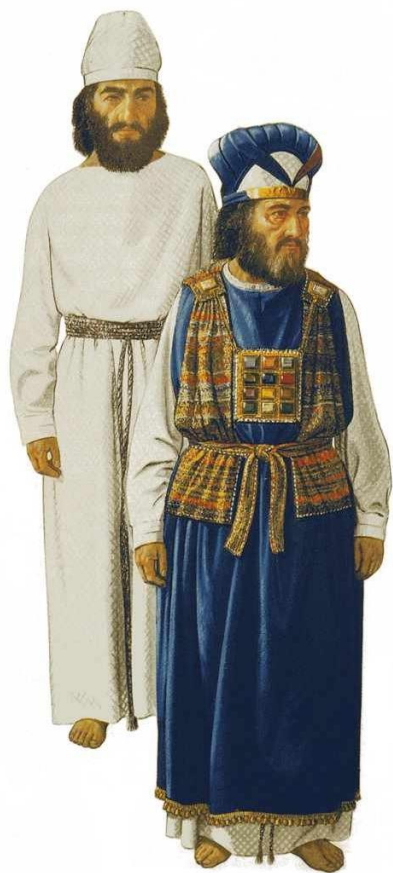
Darstellung eines jüdischen Priesters und Hohepriesters

Lichtstrahlen, um Hur, Gefährte der beiden im Kampf gegen den Nomadenstamm der Amalekiter, und um Aaron – oder um Josua, ebenfalls Mitstreiter des Mose gegen die Amalekiter, handelIn. 12