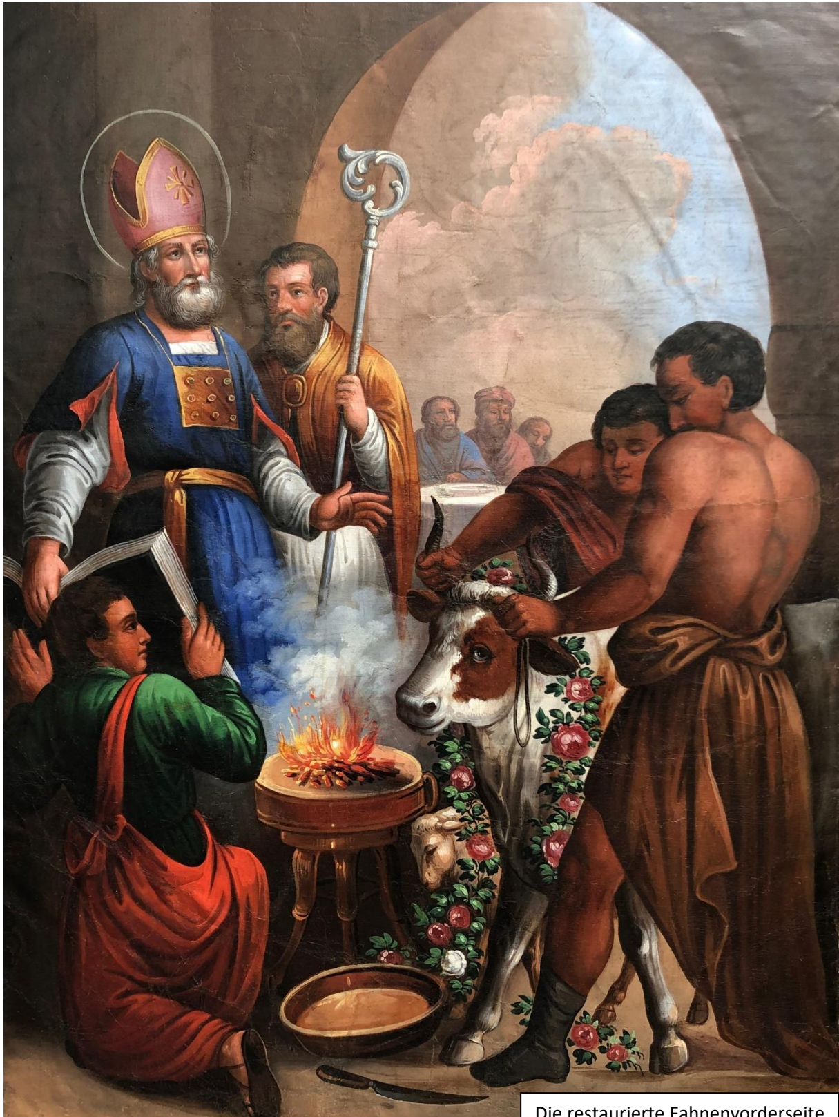
Die restaurierte Fahnenvorderseite

jüdischen rituellen Vorschriften ein Widder oder Bock geopfert werden, aber auch in anderen Details sind auf dieser Darstellung die jüdischen Vorgaben nicht genau beachtet. So finden sich etwa auf dem Brustschild, der Lostasche, nur neun statt zwölf Edelsteine, in die die Namen der zwölf Stämme Israels eingraviert waren. Bei den drei Personen im Hintergrund beim Altar bzw. Steinblock(?) dürfte es sich