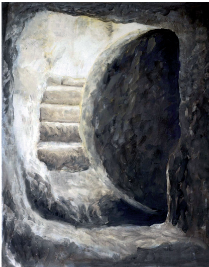
Fresko 14. Station

Ein koloriertes Schwarz-Weiß-Negativ des