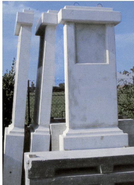
Bildstöcke im Lehrbauhof Guntramsdorf

Beton enthält selbst in der hervorragenden Qualität eines Brückenbetons immer Spuren von Gips, die bei einem darauf liegenden Fresko zu unschönen Ausblühungen führen würden. Daher musste der Betonuntergrund komplett versiegelt werden (Estrichversiegelung). Diese spiegelglatte Fläche musste nun wiederum als Haftunterlage für den Putz aufgeraut werden. Zu diesem Zweck mischte ich in die Estrichversiegelung Aerosol-Pulver (ein inertes Material, das zum Verdicken von Flüssigkeiten benützt wird) und bestrich die glatte Oberfläche mit der weißlichen Paste. So-