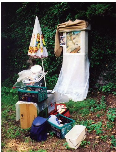
Arbeitsplatz 11. Station

Der etwa 10 Jahre eingesumpfte Kalk stammte übrigens von einem Bauern im Innviertel, leider reichte der Bestand nicht für alle Kreuzwegstationen und der später verwendete nur 7 Jahre eingesumpfte Kalk zeigte eine deutlich schlechter zu verarbeitende Qualität. Guter Sumpfkalk gehörte früher zu jedem Bauernhof, da die Ställe jedes Jahr zu Desinfektionszwecken neu gekalkt wurden. Heute findet man nicht einmal mehr in Ungarn oder der Slowakei alten Sumpfkalk, der für Fresken geeignet ist. Beim Löschen des Staubkalkes mit Wasser werden in den ersten Sekunden ca 95% des Kalkes hydratisiert, die restlichen 5% brauchen aber viele Jahre um Wasser aufzunehmen, dies macht aber den großen Qualitätsunterschied aus. Guter Sumpfkalk sollte stichfest und etwa in der Konsistenz wie Rahm sein.