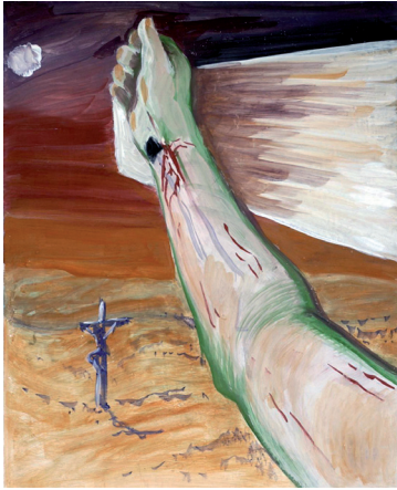
Fresko 12. Station