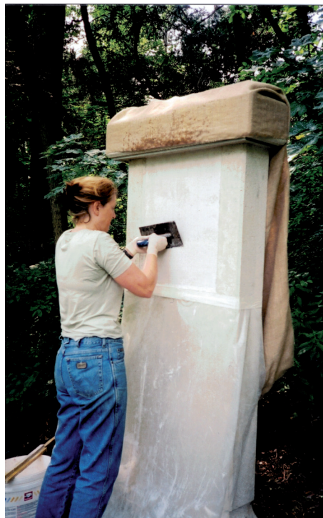
Auftragen des Feinputzes