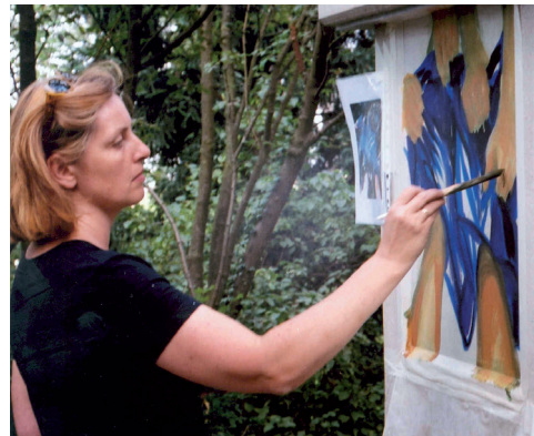
Untermalung 10. Station

Diese gestellte Aufnahme zeigt, wie eine marokkanische Djellaba (gekauft während der Marokkoreise der Pfarre 1999) von vier starken Händen von den geschundenen Armen „Jesu“ gezerrt wird. Dieses traditionelle Männergewand aus Baumwolle oder Wolle ist im Zuschnitt so gehalten, dass möglichst kein Verschnitt des gewebten Stoffes entsteht, ähnlich wie bei den traditionellen bäuerlichen Hemden des Alpenlandes („Pfoad“), der Stoff also gut wiederverwertbar ist.