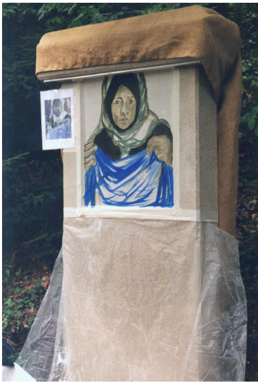
Untermalung 6. Station

fort anschließend wurde mehrfach gesiebert, gewaschener und getrockneter Streukies (Dolomit) eingestreut, insgesamt etwa 2 Tonnen. Nach Aushärtung der Versiegelungspaste wurden eventuell schlecht haftende Steinchen entfernt und die erste Schicht des Rauputzes konnte aufgetragen werden. Ein befreundeter Maurer erledigte diese Arbeit und brachte mir das Anwerfen bei. Da der Untergrund in diesem Fall nicht mit Wasser genetzt werden konnte, musste der Putz lange feucht gehalten werden, um möglichst ohne Risse zu trocknen. Dies geschah durch eigens angefertigte Jutesäcke, die über die gesamte Kreuzwegstation gestülpt und immer wieder mit Wasser besprengt wurden. Auch die zweite Schicht Rauputz wurde so aufgetragen, wobei das Mischungsverhältnis von Sumpfkalk, Wasser und Dolomitsand genau eingehalten werden musste.